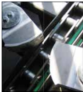
Kettenlift mit geräuscharmen Rücklaufklemmen Chain lift drive with silent anti-rollback grip