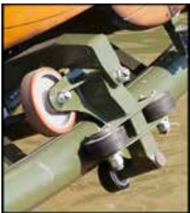
Große Laufrollen für geringe Abnutzung und überdurchschnittliche Laufruhe Big wheels for minor wearout and running smoothness